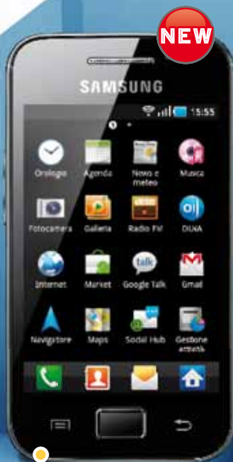
SAMSUNG GALAXY ACE