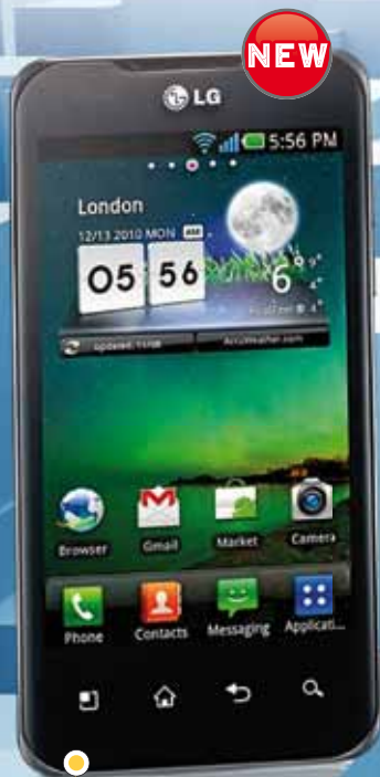
LG OPTIMUS DUAL